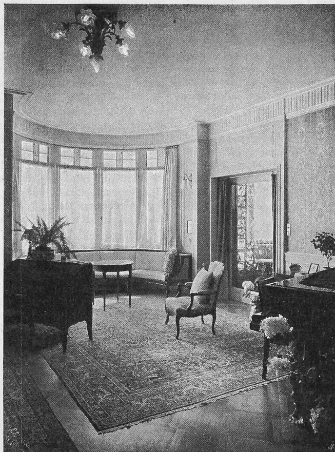
Abb. 7. Blick in den Erker des Wohnzimmers.

Eisenbahnwagen-Fenster zum Herunterschoben eingebaut, den Blick durch die Veranda ins Freie. Im Obergeschoss sind mit besonderer Sorgfalt die Toilettenräume eingerichtet. So hat z. B. das Bad neben dem Kinderschlafzimmer für Kochzwecke in Krankheitsfällen eine Kapelle mit besonderem Dunstabzug erhalten. Im Toilettenzimmer gegen Osten sind für Wäsche und Kleider reichliche und gut durchdachte Möbel eingebaut, u. a. auch ein direkt von aussen belüfteter Schuhschrank. Ein Aufzug für Wäsche und dergl. verbindet neben dem Dienstenbad alle Geschosse mit der im Dachstock des Nordflügels liegenden Waschküche und dem Glätzzimmer. Zweckmässig sind auch die Schrankräume in den Ecken der Halle im Obergeschoss und im Gastzimmer, sodann die grosse Eckterrasse gegen Süden und Osten, die durch Vorhänge längs der Brüstung zu einem wunderbaren Sonnenbad umgestaltet werden kann (vergl. auch Tafel 42). Im Dachstock findet sich u. a. noch ein grosses Gastzimmer mit Bad und Toilette.