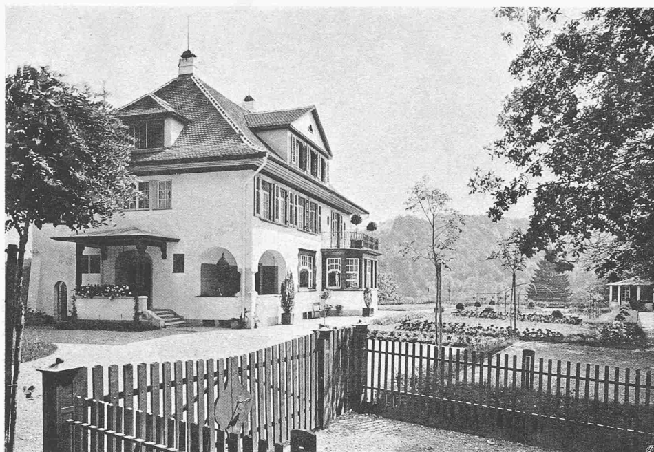
WOHNHAUS DR. FRISCHKNECHT, IM SITTERTOBEL BEI ST. GALLEN

Erbaut durch die Arch. PFLEGHARD & HÄFELI, Zürich und St. Gallen