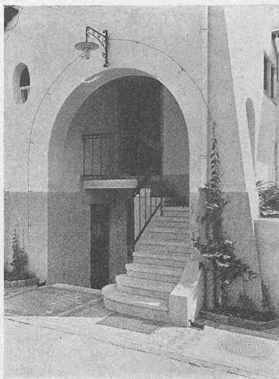
Abb. 6. Nordwestecke mit Nebeneingang.