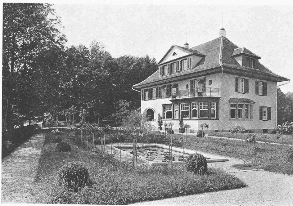
WOHNHAUS DR. FRISCHKNECHT, IM SITTERTOBEL BEI ST. GALLEN

Erbaut durch die Arch. PFLEGHARD & HÄFELI, Zürich und St. Gallen