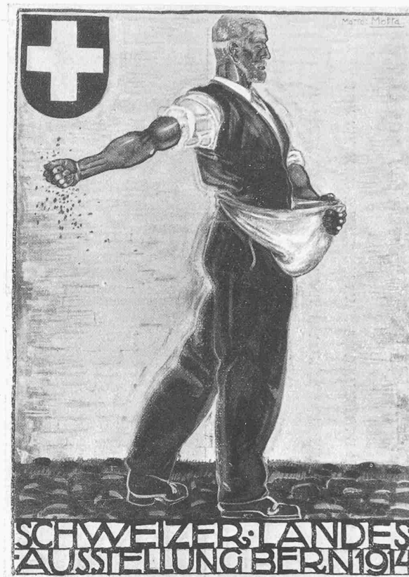
II. Preis ex aequo. Verf. O. BAUMBERGER, Zürich