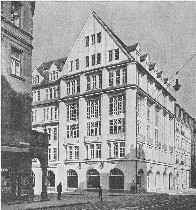
Abb. 4. Geschäftshäuser Oskar Schmid, Ecke Thiersch- und Liebherrstrasse. Erbaut 1910 durch die Architekten Höning & Söldner, München.