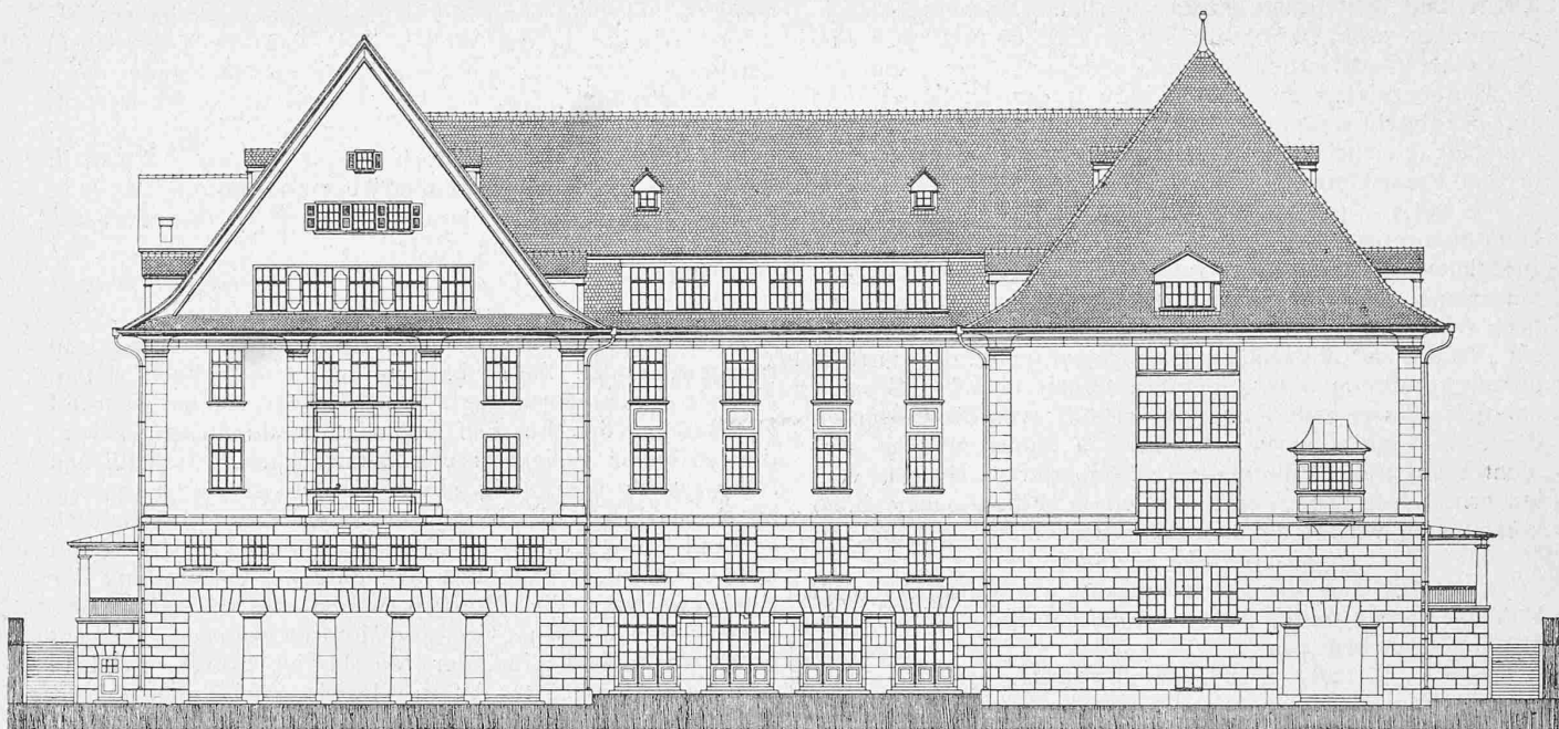
Abb. 7. Nordfassade des Heiligbergschulhauses in Winterthur. — Masstab 1 : 350.

sprache in Vado Ligure, vorbringt, ist dahin zu berichtigen, dass der grosse Vorteil hoher Kontaktdrahtspannungen, nicht nur im Falle von zur Linie nahe liegenden Kraftwerken, sondern stets vorhanden ist. Es liegt doch auf der Hand, dass ganz allgemein für eine Wechselstrombahn mit niedrigerer Fahrdrathspannung die Transformations-Unterwerke näher aneinanderrücken und gleichzeitig zahlreicher und von kleinerer Kapazität werden müssen, wodurch die Anlage sowohl in Bezug auf den Bau als auch in Bezug auf den Betrieb unrationeller ausfällt.