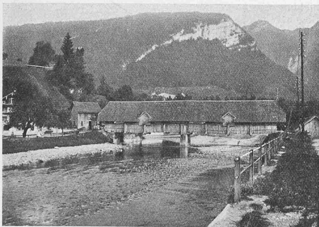
Abb. 1. Alte Muotabrücke bei Hinter-Ibach.

Die beiden Bogenrippen wurden zur Erreichung einer möglichst leichten Gestaltung auf dem Minimum von 60 cm Höhe im Scheitel gehalten, welches Mass bis zu den Auflagern auf 0,90 m anwächst. Die Breite beträgt durchwegs 0,50 m. Die Wahl des geringen Betonquerschnittes erforderte eine besonders reichliche Armierung, nämlich 2 \times 7 Rundeisen \Phi 30 \text{ mm} , die mit einer 10 mm starken Spiralarmierung von 8 cm Ganghöhe im Scheitel, bis 20 cm am Kämpfer umschlossen werden. Die Zugbänder bedürfen laut Rechnung einer 12 \times \Phi 30 \text{ mm} starken Bewehrung, die jedoch noch durch 3 bis 4 m lange Einzelstücke von \Phi 30 \text{ mm} ergänzt wurde, derart, dass auf die Schweissstellen je zweier Zugeisen ein solches Stück eingelegt worden ist. Letztere Anordnung basierte auf der Annahme, dass die über 40 m langen Zugbandeisen, die auf der Baustelle zusammengeschweisst worden sind, leicht Schwächungen an der Schweissungsstelle aufweisen könnten, und es sollten diese Ergänzungsstücke die Reduktion der Festigkeit zufolge der Schweissung decken. Zerreißproben an derart geschweissten Stücken haben die Richtigkeit