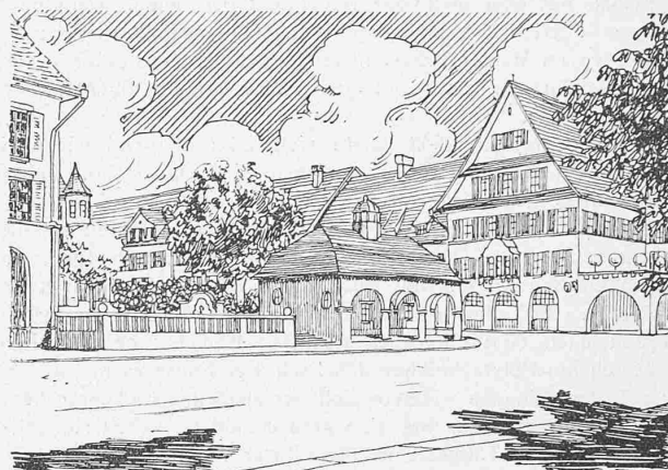
Abb. 17. Blick von Süden in den Platz R an der Kreuzung der Buchegg- und Rötelstrasse.

auch das Bauland weniger vorteilhaft aufschliesst als bei Entwurf Nr. 16 (vergl. Profil I und Plan auf Seite 225). Auch mit Rücksicht auf etappenweise Bauausführung dürfte sich das Festhalten an jenem Höhenpunkt 514 und damit an der alten Waidstrasse empfehlen. Andererseits hat die tiefere Lage des Platzes im Entwurf Nr. 20 zur Folge, dass das Spitalareal weiter südlich begrenzt wird, somit eine weniger in die Länge gezogene Form erhält, als bei den Entwürfen Nr. 16 und 31, die beide etwas von dem Gehölz in Anspruch nehmen.