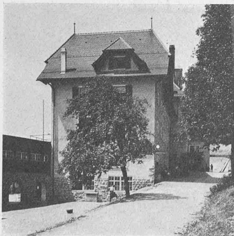
Abb. 2. Anfahrt am Sanatorium.