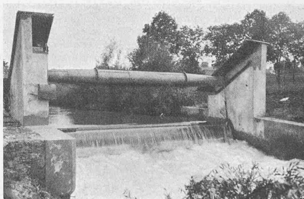
Abb. 2. Automatische Klappe in Sirmach bei Ueberflutung.

Während also Wasserstoss und Reibungskräfte so geringfügig sind, dass sie ohne Nachteil in der Rechnung vernachlässigt werden dürfen, stösst die Bestimmung des Wasserdruckes auf die Klappe auf einige Schwierigkeit.