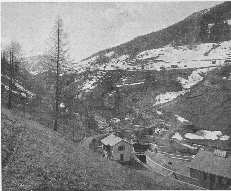
Abb. 3. Gesamtansicht der Wasserfassung bei Vissoye.