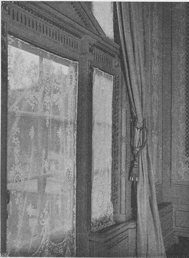
Abb. 32. Fensterheizung im Burgerratssaal des Berner Kasino.

Wie früher bemerkt, führt vom Haupt-Dampfverteiler je eine Dampfleitung zu zwei Dampfverteilern, von denen vier Gruppenleitungen direkt nach der untern, fünf Leitungen durch den von oben kommenden Zuluftschacht für G, S und F