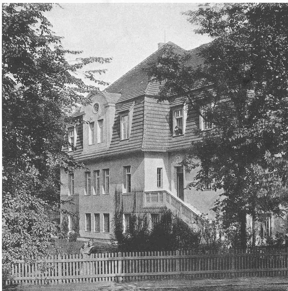
AERZTEWOHNHAUS DER ANSTALT BUCH BEI BERLIN

Architekt Dr.-Ing. LUDWIG HOFFMANN, Stadtbaurat, Berlin