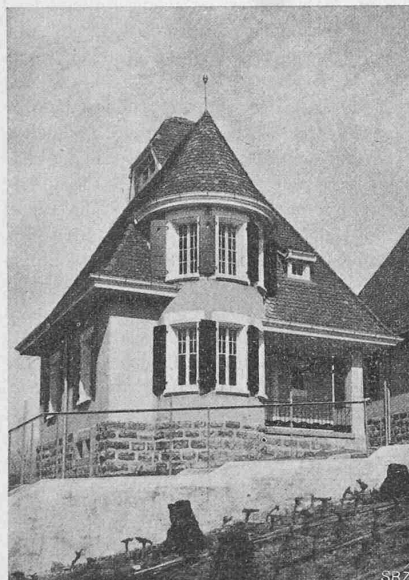
Abb. 8. Einfamilienhaus Nr. III.

gesetzlich zulässigen Abständen von 5,40 m zu stehen kamen. Dieses enge Aufeinanderücken hat natürlich den Eindruck der Anlage etwas beeinträchtigt, obwohl Besonnung und Belüftung absolut einwandfrei sind. Auch können sich dadurch, dass jeweils die Fenster auf der Nordseite nach Möglichkeit unterdrückt worden sind, die Nachbarn nicht von einem Haus ins andere sehen. Der Zu-