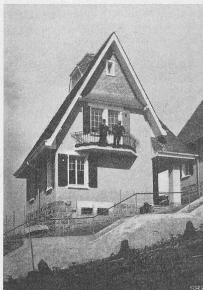
Abb. 7. Einfamilienhaus Nr. II.

gegen schwarz. Im Innern wurde bei aller Einfachheit auf äusserste Behaglichkeit gesehen. Die Fussböden bestehen aus Pichpineriem. Die Vorplätze, Küche, Bad, W. C. erhielten einen Plättchenbelag, die Vorhalle einen Mosaikboden.