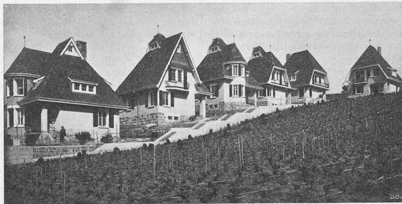
Abb. 6. Gesamtansicht der Kolonie Montgibert von Südosten.