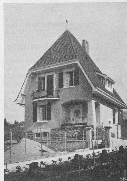
Abb. 10. Einfamilienhaus Nr. VI.

gegen schwarz. Im Innern wurde bei aller Einfachheit auf äusserste Behaglichkeit gesehen. Die Fussböden bestehen aus Pichpineriem. Die Vorplätze, Küche, Bad, W. C. erhielten einen Plättchenbelag, die Vorhalle einen Mosaikboden.