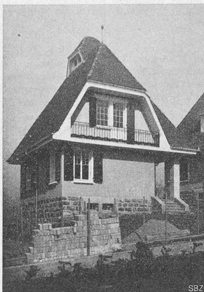
Abb. 9. Einfamilienhaus Nr. IV.

stellen, ist ein Vergleich der hier vorliegenden Häuschen mit der „Kolonie Montgibert in Clarens.“