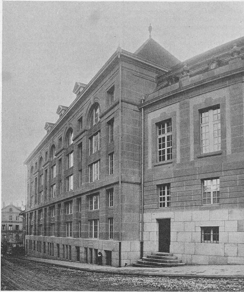
Fig. 4. Bâtiment des magasins des livres.