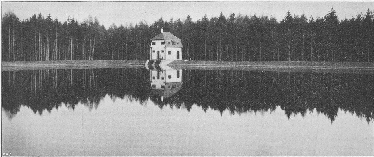
Abb. 24. Ansicht des gefüllten Weihers mit dem Wasserschloss im Engwald, von Westen gesehen.