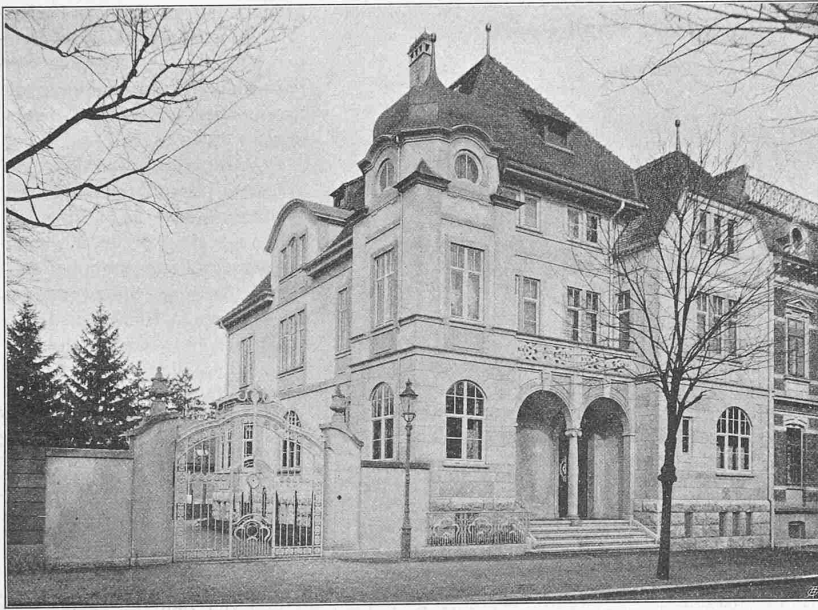
Abb. 4. Gesamtsicht von Süden.

Erbaut von der Architektenfirma Romang & Bernoulli in Basel.