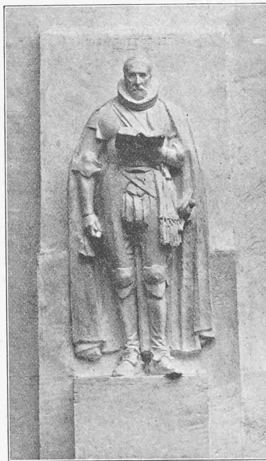
Modell einer Nebenfigur.

I. Preis. — P. Landowski und H. Bouchard.