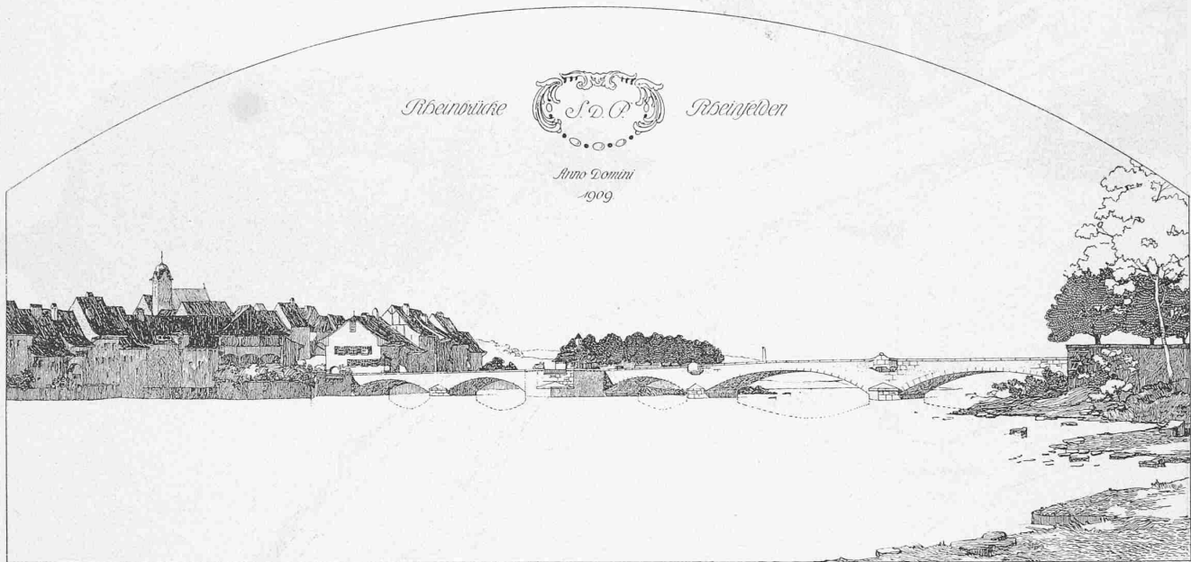
Abb. 1. II. Preis. Nr. 17. — Verfasser: Ingenieure Maillart & Cie. in Zürich, Architekten Joss & Klausner in Bern. — Gesamtansicht.