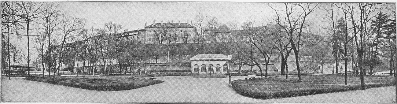
Ansicht der «Promenade des Bastions» mit dem «Mur des Réformateurs». In der Mitte die Orangerie; darüber das Hôtel de ville.