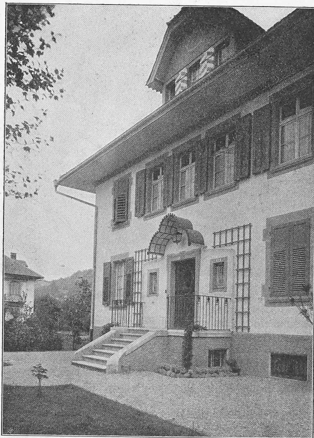
Abb. 8. Ansicht von der Strassenseite.