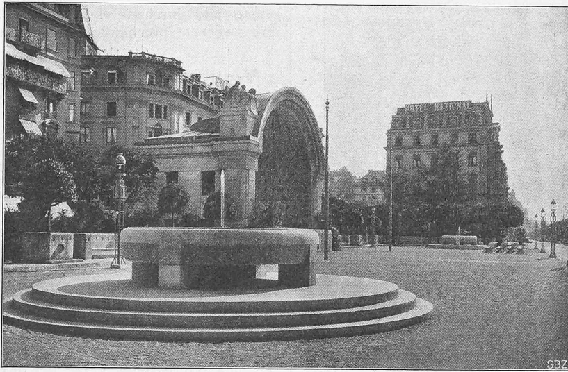
• Abb. 1. Ansicht des neuen Kurplatzes in Luzern von Westen.

Mit den Bauarbeiten des Musikpavillons konnte am 16. März d. J. begonnen werden, nachdem die Bäume der frühern Anlage verpflanzt und die Platzgestaltung im Rohen vorbereitet worden war. Der ganze Bau ruht auf einer armierten Betonplatte; auch die Umfassungswände bis zur Höhe des Podiums, die beiden Pylonen und die teilweise armierte Kuppelkonstruktion sind aus Beton hergestellt worden. Die Muschel besteht aus einem doppelten Gewölbe mit einem Hohlraum von 0,60 m zwischen beiden Kappen. Das äussere Gewölbe er-