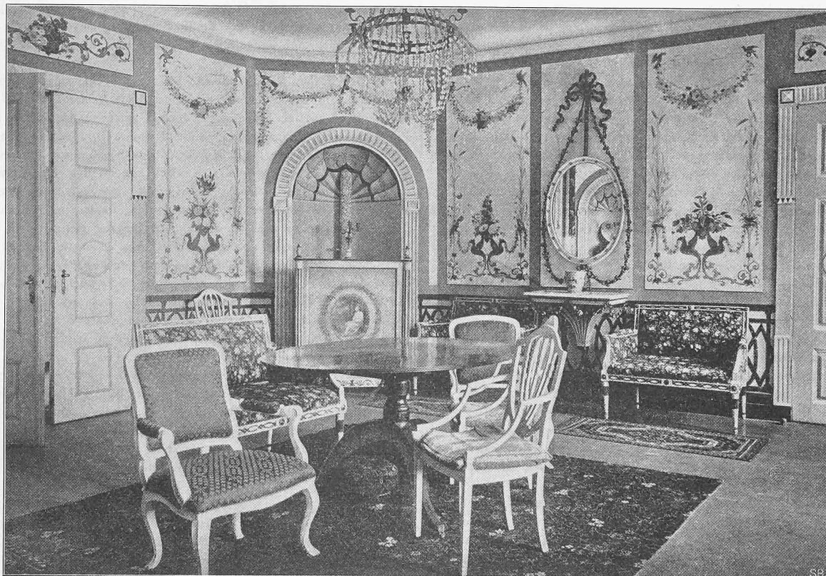
Abb. 4. Blick in den Gartensaal des Schlösschens Liselund auf Möben (vergl. Literatur Seite 56).

technischen Hochschule ergriff der Vorsitzende das Wort, um in einer ausserordentlich gediegenen und schwungvollen Ansprache die Verdienste und die Arbeit des Grafen Zeppelin um die Luftschiffahrt und des Herrn Prof. Dr. Stodola um die Konstruktion der Dampfturbinen zu feiern und um der Versammlung den Antrag ihres Vorstandes vorzulegen, wonach den beiden gefeierten Männern die höchste Auszeichnung, die Verleihung der goldenen Grashofdenkmünze durch den Verein zuerkannt werden solle. Mit grossem Beifall wurde dieser Antrag gutgeheissen und insbesondere der anwesende Graf Zeppelin mit nicht endenwollendem Beifall gefeiert. Herr