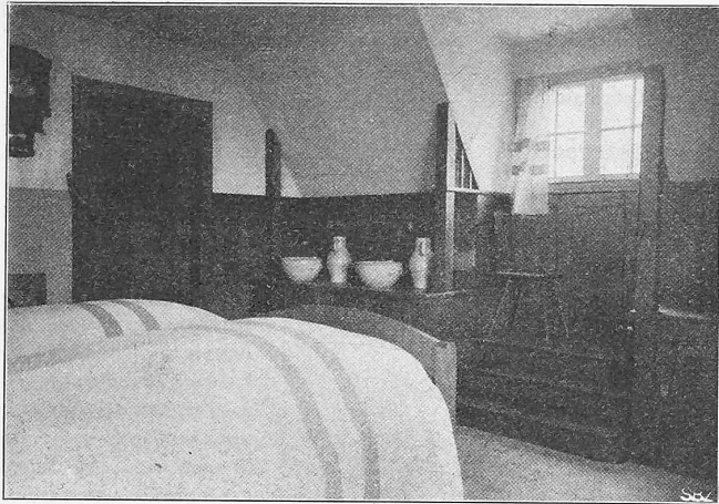
Abb. 18. Blick in das Schlafzimmer im Hause von Dr. Finckh.