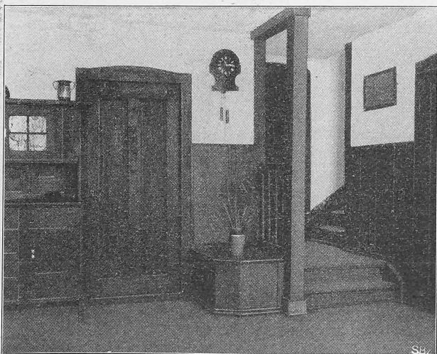
Abb. 24. Treppenecke im Wohnzimmer des Sommerhauses «Rotenhus» bei Berlingen.

statistik mitgeteilten Detailziffern für die betreffenden Positionen in einer „Uebersicht der Ein- und Ausfuhr von Kohlen, Koks, Eisen, Metallen, Maschinen und Maschinenteilen im Jahre 1907“ dem Berichte angefügt.