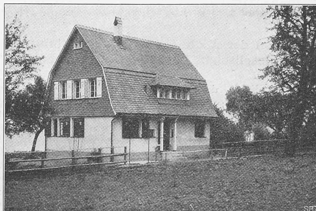
Abb. 21. Ansicht des Sommerhauses «Rotenhus», Landseite.

1905 auf 1906. Der Verbrauch an Kupfer in Barren ist von 10009 q im Jahre 1906 auf 10852 q im Berichtsjahre gestiegen, d. h. um rund 7,75 %; es gingen davon mehr ein aus Deutschland 230 q und aus den Vereinigten Staaten 2140 q, dagegen weniger aus Frankreich 1200 q und aus Gross-