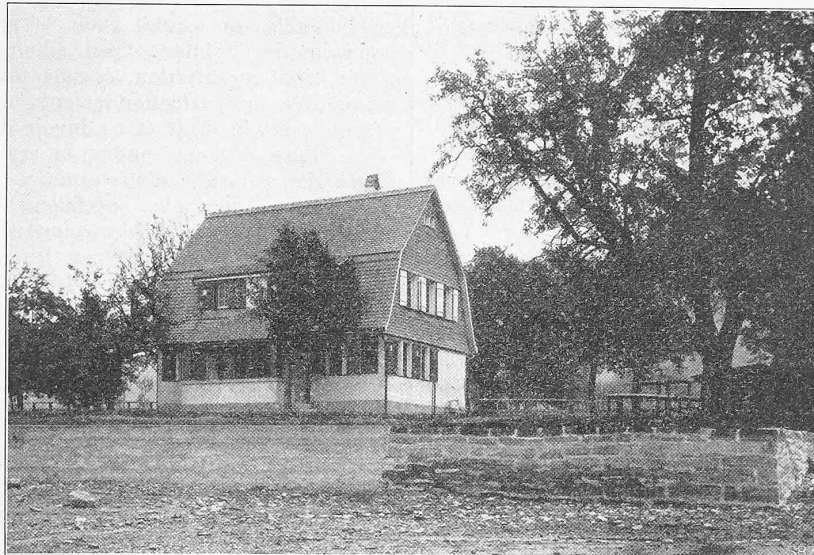
Abb. 20. Ansicht des Sommerhauses «Rotenhus» bei Berlingen vom Seeufer her.

Von Architekt H. Hindermann in Steckborn.