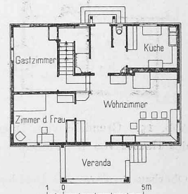
Abb. 22. Grundriss vom Erdgeschoss des Sommerhauses «Rotenhus». — 1:400.

Dagegen gewähren die Einfuhrziffern der Position 879880 «roh vorgearbeitete Maschinenteile» für die Jahre 1906 und 1907 wieder Ein-