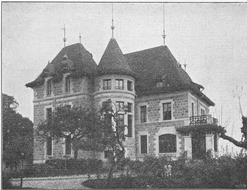
Fig. 3. La villa Diserens au Signal près Lausanne. Architecte M. Louis Bezencenet, Lausanne.

Un architecte dont nous avons déjà signalé les œuvres dans l'étude de l'architecture moderne de Lausanne, M. Louis Bezencenet, a cherché un groupement pittoresque des masses dans sa villa Diserens au Signal. Le plan est