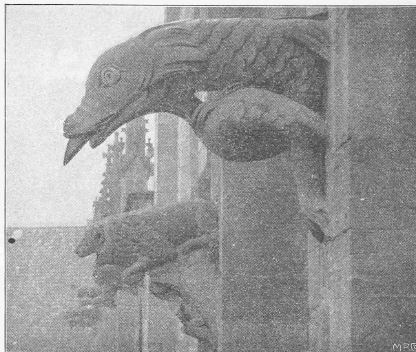
Abb. 2. Wasserspeier an der nördlichen Langhausfassade.

die Spannweiten sind so gegen einander abgestimmt, dass die Horizontalschübe für Eigengewicht gleich werden, wodurch die Pfeilerstärke am Kämpfer auf das Mindestmass von 3 m beschränkt werden konnte. Die Mittellinie der Gewölbe fällt mit der Drucklinie für Eigengewicht zusammen. Ausserdem sind zwei weitere Entwürfe in Massivbau (ähnliche Abmessungen in Eisenbetonkonstruktion) angekauft worden. Erfreulicherweise haben die Mülheimer Stadtverordneten dem Vorschlage des Preisgerichts zugestimmt, wodurch die Ausführung des an erste Stelle gesetzten Projektes, dessen Kostenvoranschlag rund 820 000 Fr. erreicht, gesichert ist.