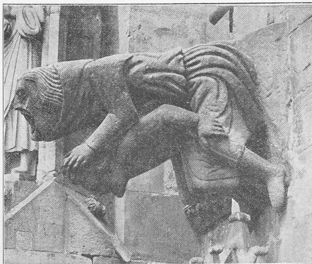
Abb. 3. Wasserspeier an der südlichen Langhausfassade.