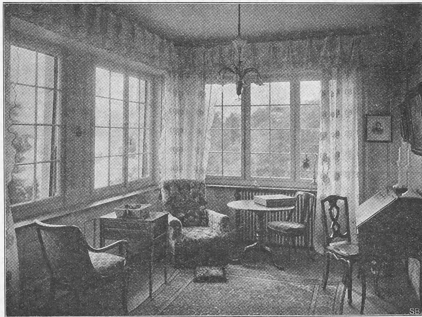
Abb. 6. Blick in die Fensternische des Wohnzimmers im ersten Stock.

Erbaut von Pflegard & Haefeli , Architekten in Zürich.