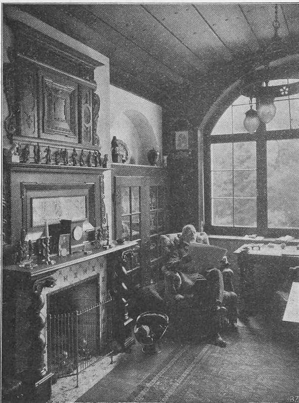
Abb. 7. Aus dem Herrenzimmer.

„Die schweizerische Ausstellung über Eisenbahnanlagen und Eisenbahnsignalwesen durfte sich neben denjenigen ganz wohl sehen lassen. Man konnte nur bedauern, dass die Plazierung so ungünstig war. Die neuen Geleiseanlagen der Bundesbahnen mit Schienen von 46 und 49 kg per m für die Hauptlinien und 36 kg für weniger stark befahrene Strecken sind den Anlagen in Deutschland, Frankreich und Italien ebenbürtig und stehen weit über denjenigen in Oesterreich und Ungarn. Auch die Signaleinrichtungen und die zentralen Weichen- und Stellwerkanlagen dürfen zu den besten gerechnet werden. Die Bundesbahnen hatten neben dem Simplontunnels und demjenigen, wie er auf Hauptlinien zur Ausführung kommt, auch neue Weichenanlagen ausgestellt, die entschieden viel kräftiger gebaut und ebenso gut konstruiert sind, wie die von den deutschen, italienischen und österreichischen Bahnen vorgeführten.