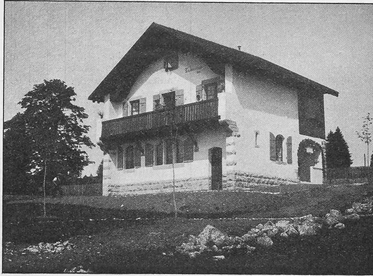
Fig. 1. Façade Sud-Est.

Architectes: Wild & Baeschlin, succ. de R. Wild à St. Imier.