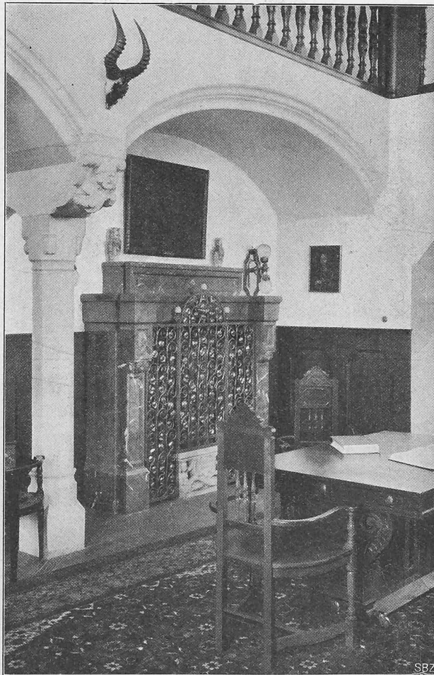
Abb. 11. Das Kamin in der Halle.

Erbaut von Architekt Carl Bauer-Ulm in München.