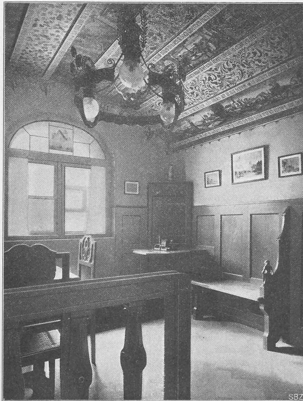
Abb. 15. Das Kneipzimmer im Erdgeschoss neben der Halle.

Erbaut von Architekt Carl Bauer-Ulm in München.