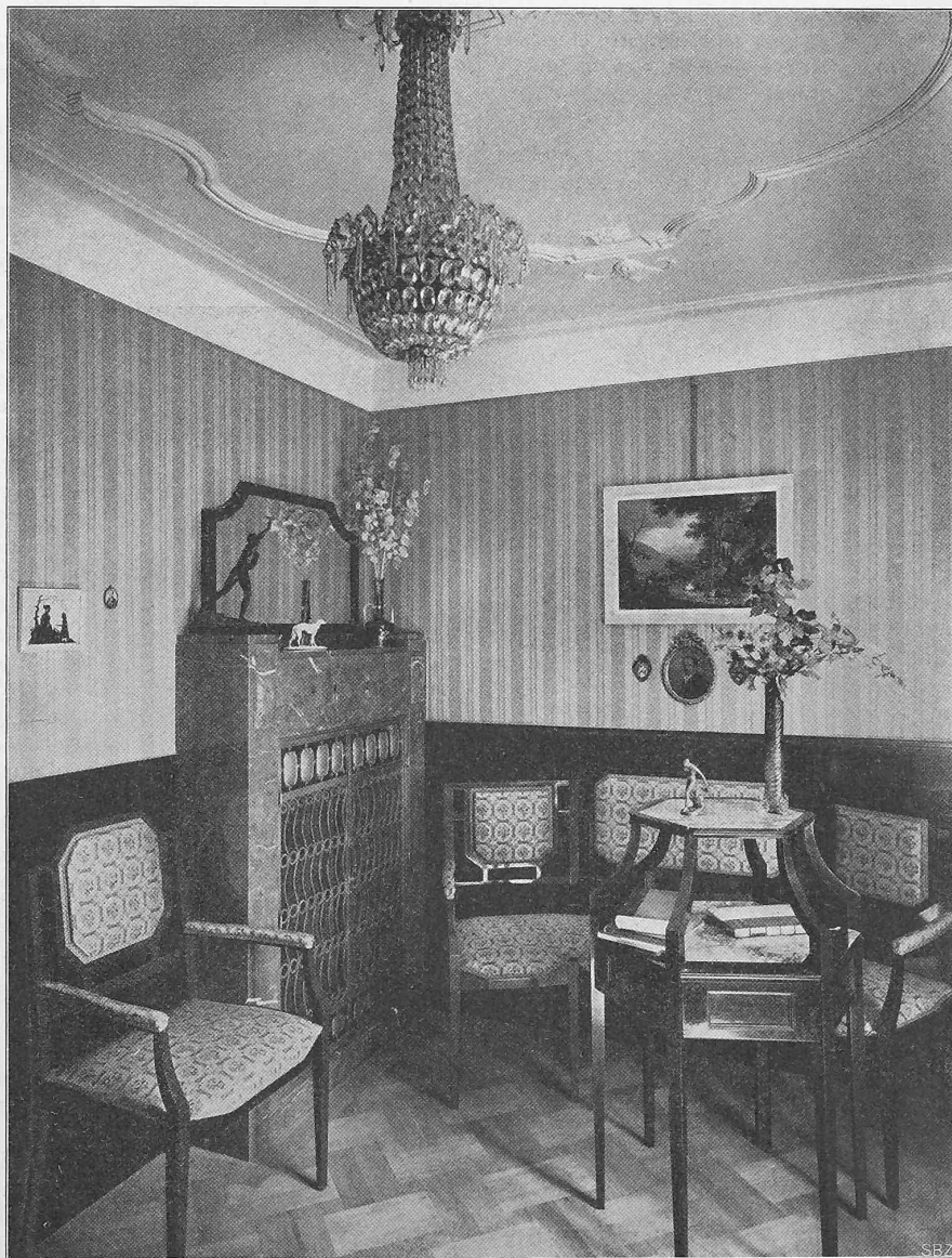
Abb. 12. Das Damenzimmer.

Erbaut von Architekt Carl Bauer-Ulm in München.