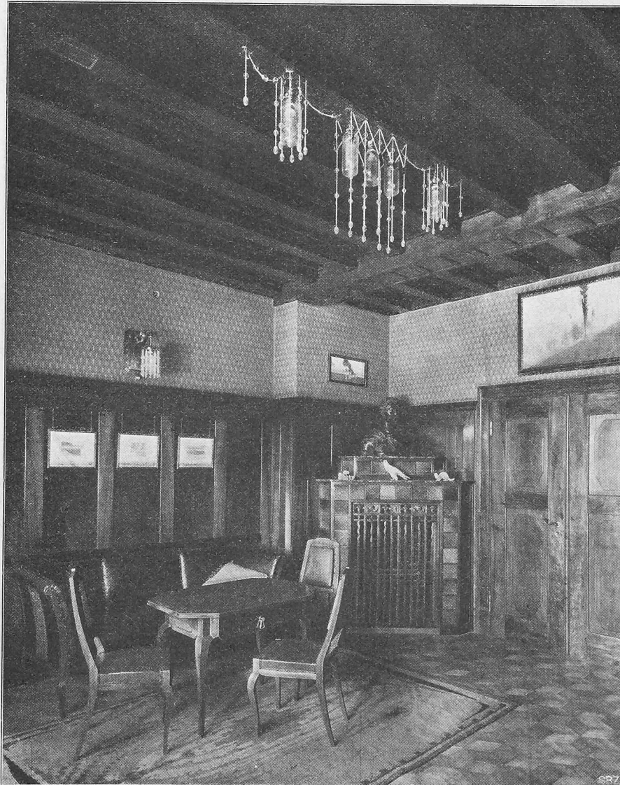
Abb. 13. Das Herrenzimmer.

Erbaut von Architekt Carl Bauer-Ulm in München.