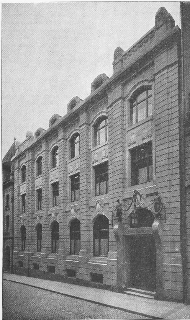
Abb. 10. Ansicht der Hauptfassade in der Freienstrasse.

Erbaut von Architekt Emil Faesch in Basel.