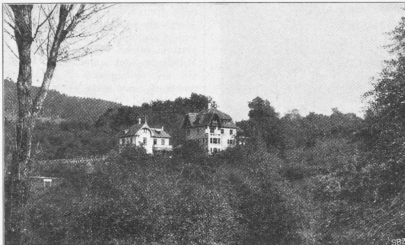
Abb. 11. Ansicht der Villa «Im Oberland» an der Hofstrasse in Zürich V von Süden. Erbaut von Architekt Th. Oberländer-Rittershaus in Zürich V.

Hoch oben am Zürichberg an der Hofstrasse hat sich Architekt Oberländer-Rittershaus zwischen schattigen Bäumen an kühlem Tobel 1904 sein eigenes Heim „im Oberland“ erbaut. Auf dem nach Süden steil abfallenden terrassenförmigen Gelände, das östlich durch den Susenbergbach und südlich durch den Wolfbach begrenzt wird, steht in der Südwestecke die ganz in schottischem Mauerwerk ausgeführte Villa. Mit den steilen, kräftig roten Mansardendächern, die an den Giebelseiten über dunkel gestrichenen Holzbalkonen weit ausladen, hebt sich das Ganze von dem sattgrünen Hintergrunde wirksam ab (Abb. 11). Das Gebäude enthält in drei Stockwerken 12, meist sehr geräumige Zimmer, dazu im Erdgeschoss eine Veranda, die als Wohnzimmer vielfach benutzt wird, und im Kellergeschoss anstossend an eine offene Laube ein grosses Kinderspielzimmer. Die Abmessungen der meisten Zimmer übertreffen die bei einem Einfamilienhaus dieser Art üblichen und sind deswegen so reichlich gewählt worden, weil das Haus auch als Land-erziehungsheim zur Aufnahme