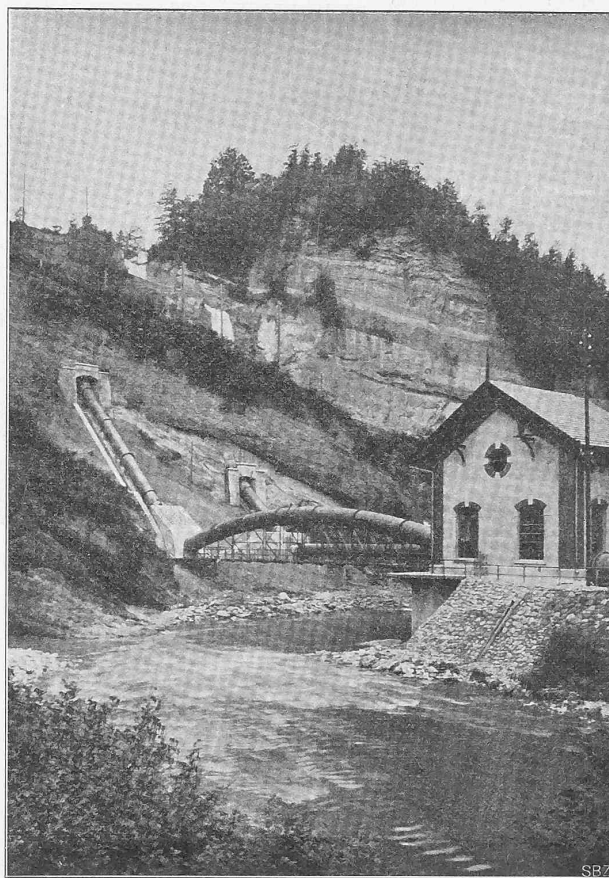
Abb. II. Ansicht des Maschinenhauses mit der zweiten Druckleitung.

Mauerkrone hinüber geführt würde. Allerdings kann der Weiher mittels dieser Ausführungsweise nur um etwa 7 m gesenkt werden, was indessen wenig zu sagen hat, da der tiefer liegende Teil des Weiherinhaltes nur noch 400 000 m 3 beträgt und eine tiefere Absenkung bisher überhaupt noch nicht vorgekommen ist; die ganze Entleerung kann aber jederzeit mittels der alten Leitung erfolgen.