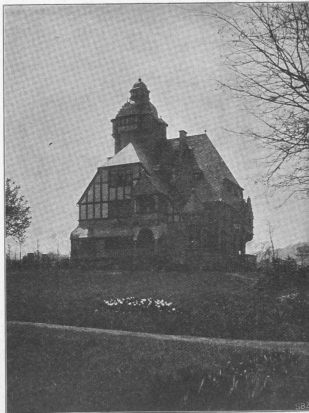
Abb. 2. Gartenansicht der Villa Castenholz auf der Rheininsel Oberwerth.

Der Grundriss ist nach annähernd denselben Grundsätzen entworfen wie jener der Villa Castenholz, die innere Einrichtung, besonders die der Halle, des Esszimmers sowie des Arbeitszimmers ganz besonders durchstudiert und für die verwöhntesten Ansprüche ausgedacht.