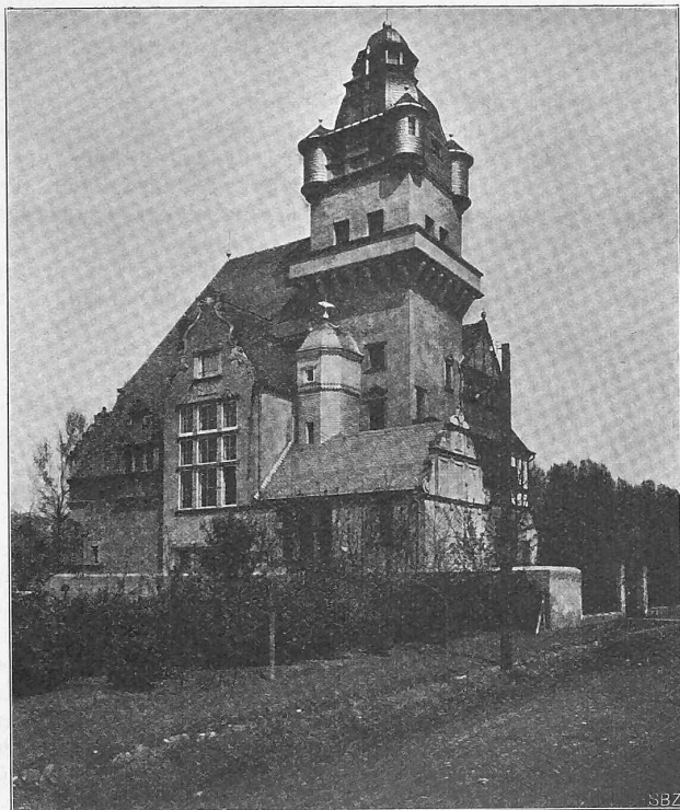
Abb. 1. Villa Castenholz auf der Rheininsel Oberwerth.

den an eine vierzylindrige gemischte Lokomotive gestellten Anforderungen gerecht wird, darf wohl angesehen werden, dass in der kurzen Zeit seines Bestehens schon eine grössere Anzahl solcher Maschinen bestellt worden ist. So hat gegenwärtig die Lokomotivfabrik Winterthur ausser drei neuen Lokomotiven für die Brünigbahn noch weitere gleiche Lokomotiven für die Berner Oberlandbahnen in Arbeit.