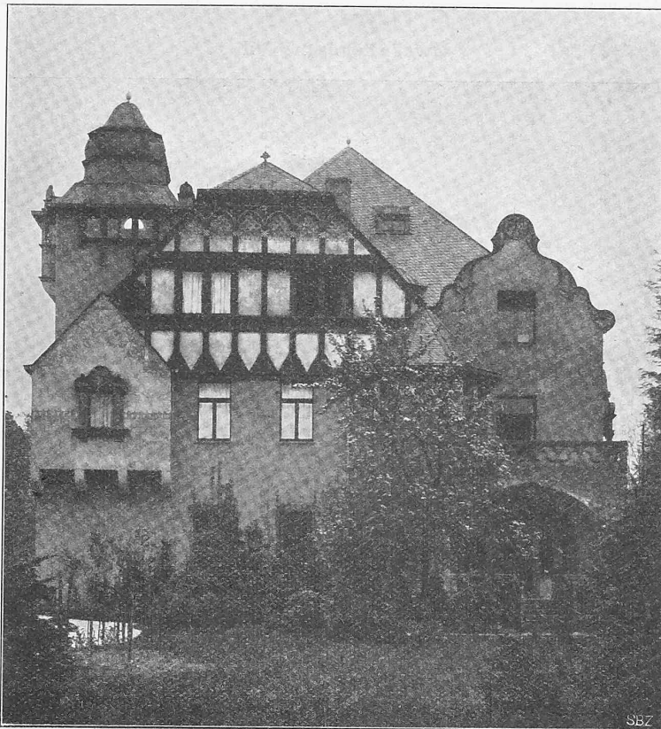
Abb. 4. Haus Osterroth in Koblenz. — Gartenfassade. Von Architekt Willy Bock in Koblenz.