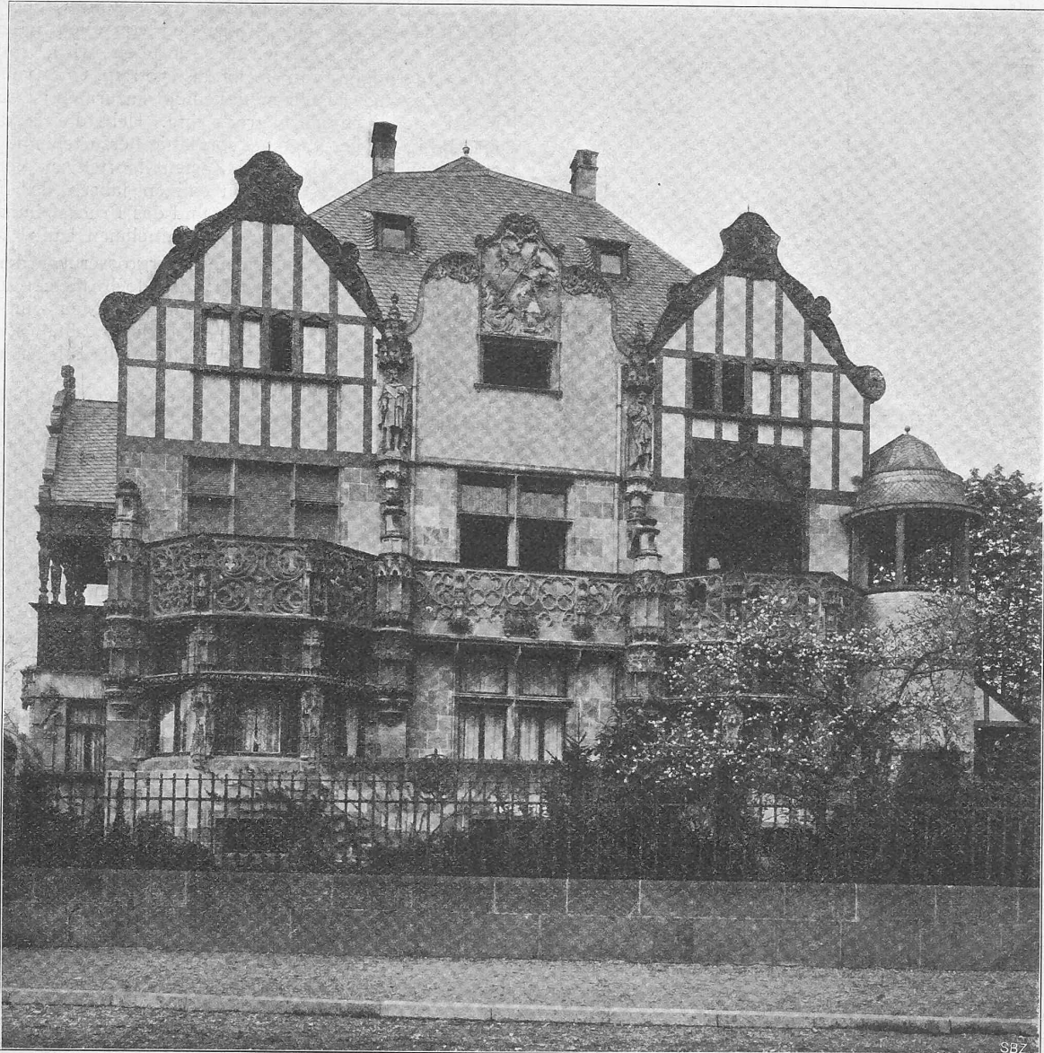
Abb. 6. Haus Osterroth in Koblenz. — Strassenfassade. — Architekt Willy Bock in Koblenz.

Bekanntlich rechnet man in gewöhnlichen Fällen, dass zwei eingleisige Tunnel etwa 130% eines zweisepurigen kosten. Bei Tunneln unter hoher Ueberlagerung aber verschiebt sich dies Verhältnis, weil zum Zwecke der Lüftung, sobald die Felstemperatur 25^{\circ} überschreitet, so grosse Luftmengen (30 bis 40 m^3 in der Sekunde) eingeblasen werden müssen, dass die dafür erforderlichen Röhren in den unvollendeten Tunnelstrecken keinen Platz finden, sondern — sowohl beim einspurigen, wie beim zweisepurigen Tunnel — durch besondere, ausserhalb liegende Stollen ersetzt werden müssen.