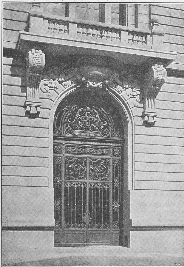
Abb. 8. Ansicht des Haupteingangs.

Franken belief, nachdem sie sich seit 1900 in geometrischer Progression entwickelt hatte. Diese Angabe musste für jeden Techniker, der auch wirtschaftlich zu überlegen gewohnt ist, eine fast stupende Wirkung haben. Sie besagt uns, dass wir hier eine Fahrzeugfabrikation vor uns haben, die bereits alles übertrifft, was je in einem Jahre in Frankreich für Eisenbahnfahrzeuge geleistet worden ist. Entsprechend der aufsteigenden Tendenz werden auch die folgenden Jahre noch weit grössere Leistungen aufweisen. Die bessern französischen Fabriken sollen bis 1907 mit Bestellungen versehen sein. Daneben gehen Deutschland, England und Amerika in der Automobilindustrie mit Riesenschritten voran. Amerika soll Frankreich heute bereits überholt haben. Infolge der weit über das Angebot hinausgehenden Nachfrage wird fast nur für den Luxus gearbeitet, und die Preise sind entsprechend hoch. Wenn einmal der Luxus in gewissem Grade gesättigt sein wird, dann werden die Fabriken daran gehen können, geeignete Fahrzeuge für den gemeinen Mann, für den Bauern auszubilden und der Herstellung von Wagen für den öffentlichen Verkehr und den Lastentransport mehr Aufmerksamkeit zuzuwenden.