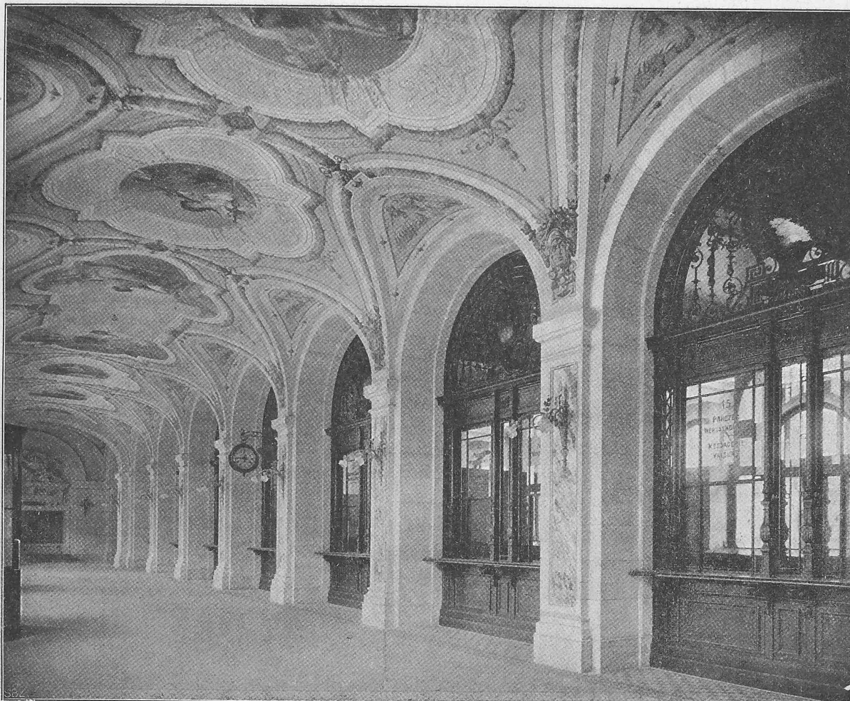
Abb. 9. Blick in die Schalterhalle.

Erbaut von den Architekten Eug. Jost und E. Baumgart in Lausanne und Bern.