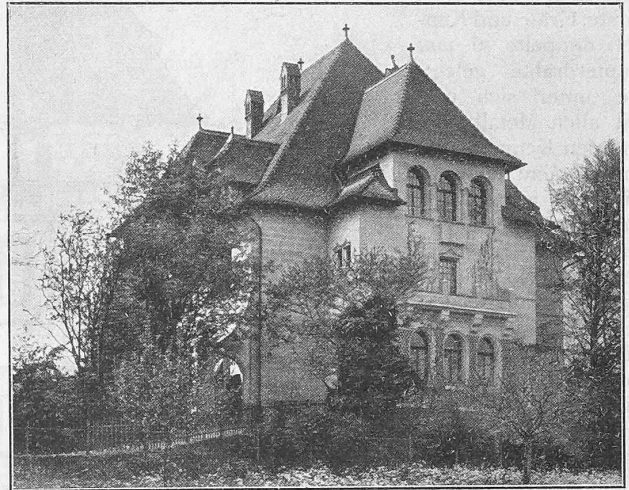
Abb. 2. Ansicht der Villa Sonnenberg von Norden.

In dem auf der Süd- und der Westseite höher freiliegenden Kellergeschoss befinden sich an der Westseite die Waschküche und die Räume für die Zentralheizung, unter