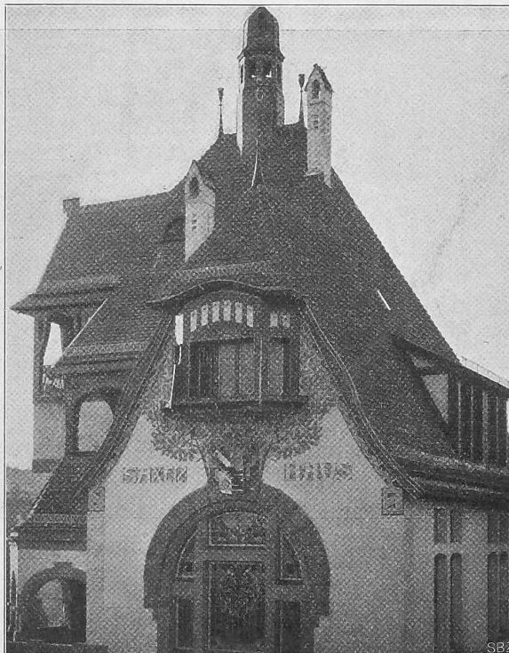
Abb. 7. Dach- und Giebel detail.

Erbaut von Architekt Emil Rein aus Zürich in Stuttgart.