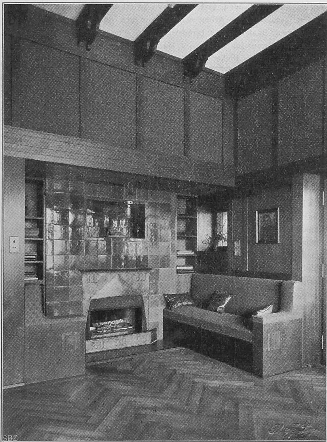
Abb. 10. Kaminnische im Arbeitszimmer.

Zweiflüglige Schiebetüren öffnen die Halle gegen das Speisezimmer einerseits und gegen das Wohnzimmer andererseits. Der hintere Hallenteil führt zum Herrenzimmer und besitzt einen Durchgang unter der Treppe zum Dienerzimmer und zum Servicegang.