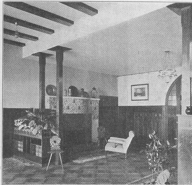
Abb. 13. Kamin in der Halle.