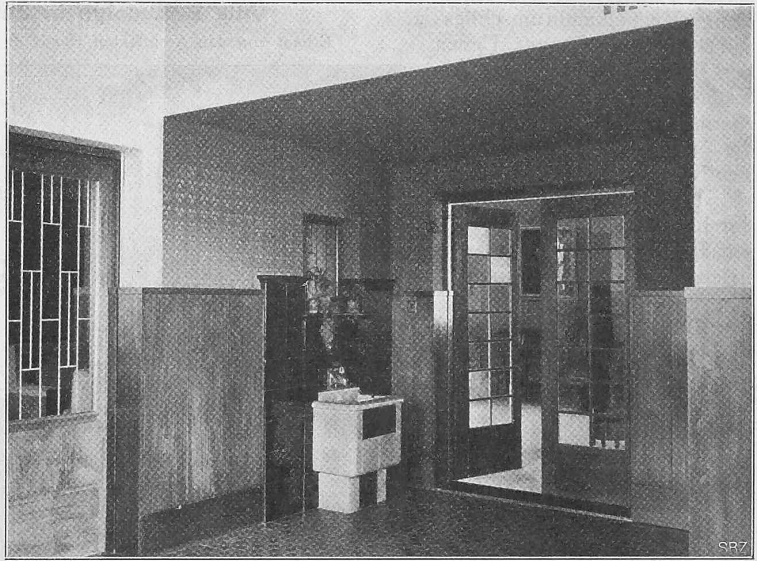
Abb. 12. Brunnennische der Veranda mit Blick in das Wohnzimmer.

Das Speisezimmer (Abb. 11), 6 m breit und 8 m lang, geht am Nordende in einen sechseckigen Anbau über, der als Frühstückszimmer benützt werden kann. Speisezimmer und Anbau haben 1,80 m hohe eichene, ammoniakgeräucherte Wandvertäfelungen, deren glatte Flächen mit Einlagen aus blaugrünem Granitglas und Ebenholz geziert werden. Das