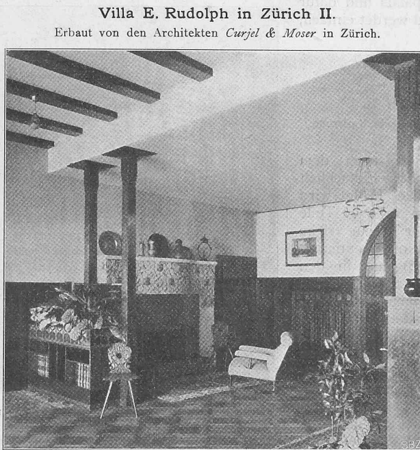
Abb. 13. Kamin in der Halle.