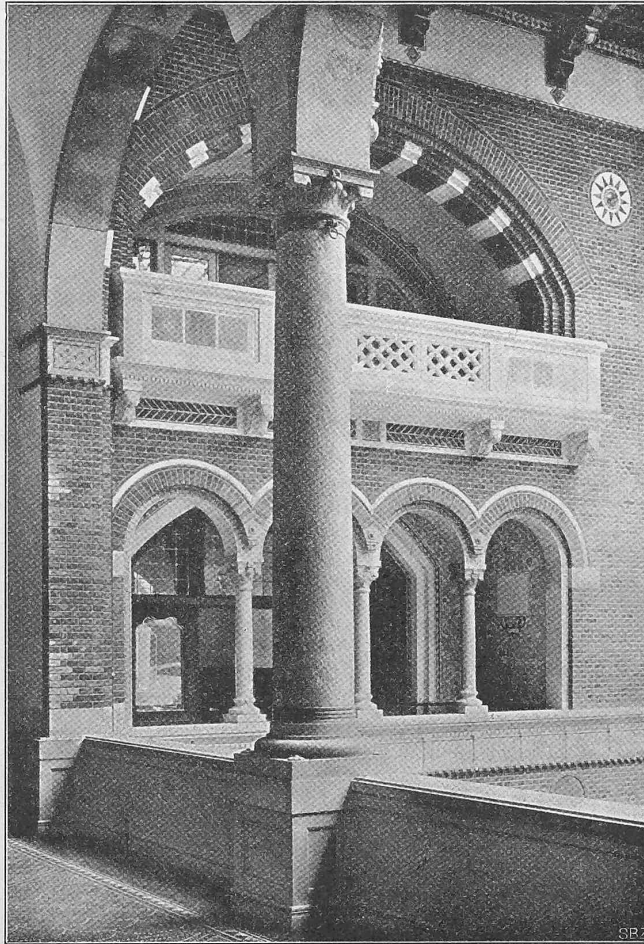
Abb. 4. Loggiendetail aus dem gedeckten Hofe. (Nach „Beispiele angewandter Kunst“, vergl. S. 203.)