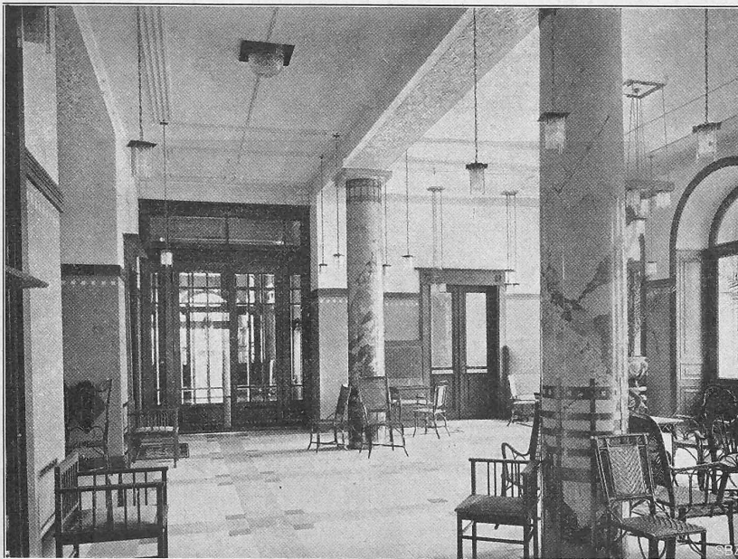
Abb. 2. Blick in die Halle.

Ausgeführt nach Entwürfen der Architekten Tscherner & Durrer in Zürich.