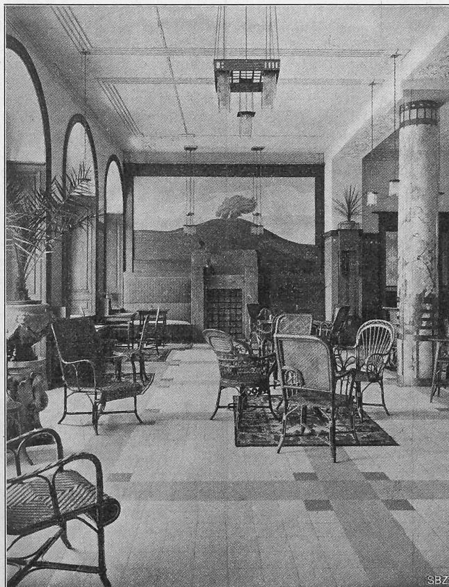
Abb. 1. Blick in die Halle gegen die Kaminwand.

Ausgeführt nach Entwürfen der Architekten Tschärner & Durrer in Zürich.