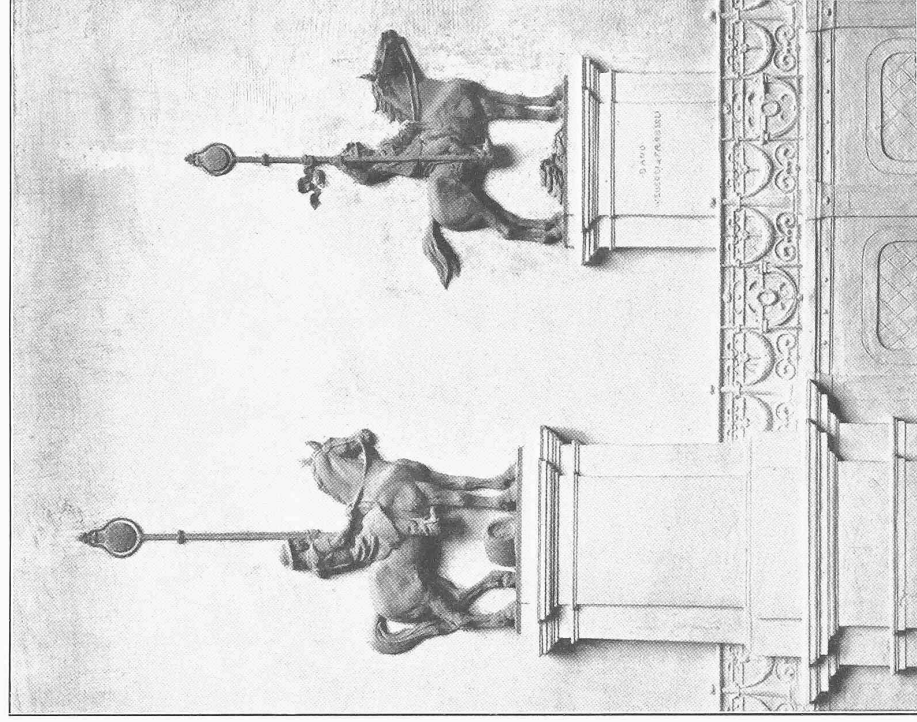
Strompfeiler der Kleinbasler-Seite.