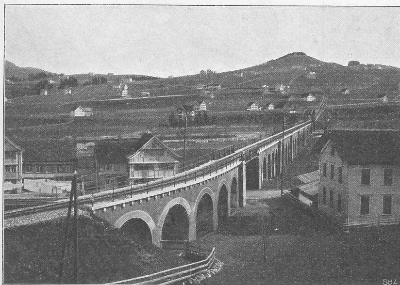
Abb. 2. Viadukt bei Appenzell. — Ansicht von Süden.

Der Unterbau erhielt eine Breite der Erdplanie von