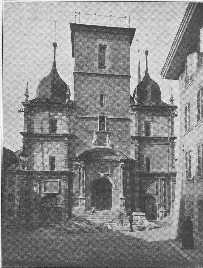
Abb. 1. Die alte Ostfassade des Rathauses zu Solothurn.

Erbaut 1623—1626, 1704 und 1711 nach den Rissen von Baumeister Gregorius Btenkher .