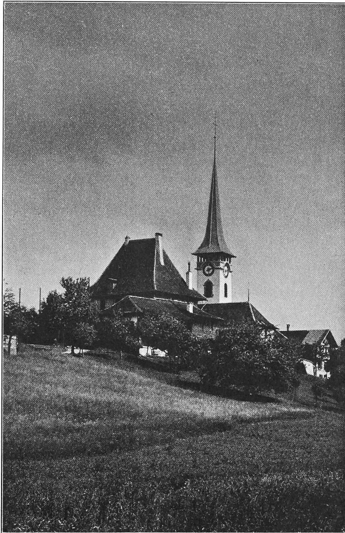
Abb. 1. Ansicht des Kirchturms in Münsingen.

So war der Architekt im Sinne der alten Baumeister mit Fleiss und Geschick bestrebt, seinen Neubau mit der Umgebung in harmonische Uebereinstimmung zu bringen und bemühte sich, statt durch komplizierte und teure Architektur motive allein durch anspruchslose aber den örtlichen Verhältnissen angepasste Ausgestaltung eine ruhige und schöne Wirkung hervorzurufen. Dass sein Streben nicht umsonst war, beweist das nebenstehende Schaubild des neuen Turmbaus.