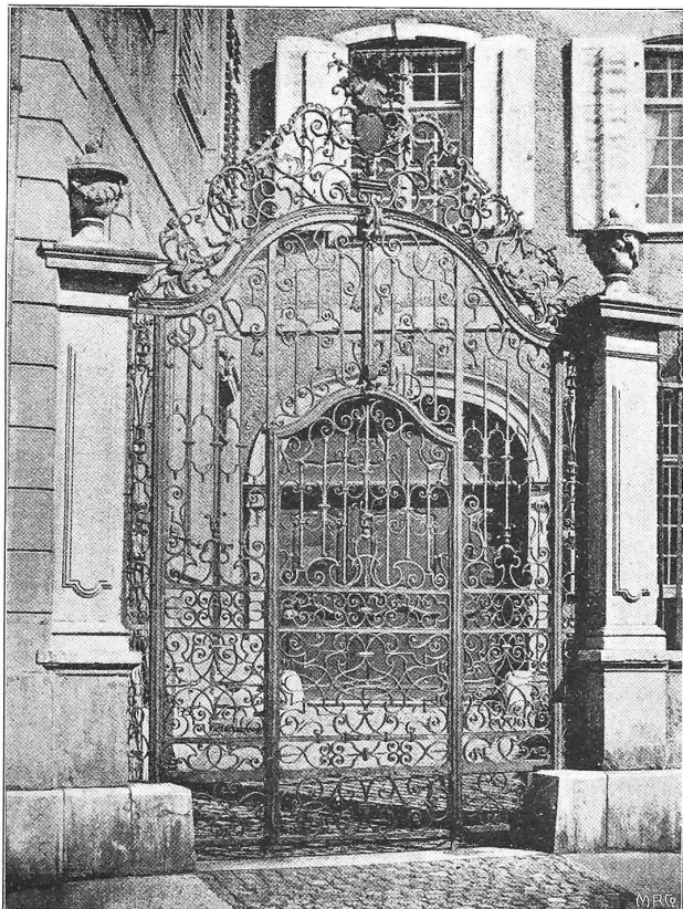
Abb. 2. Gittertor vom «Gutenhof».

Herausgegeben vom Ingenieur- und Architekten-Verein Basel 1904.