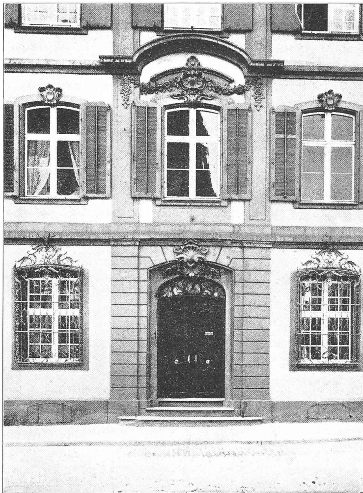
Abb. 1. Mittelpartie des Hauses «Zum Delphin».

Herausgegeben vom Ingenieur- und Architekten-Verein Basel 1904. 1)