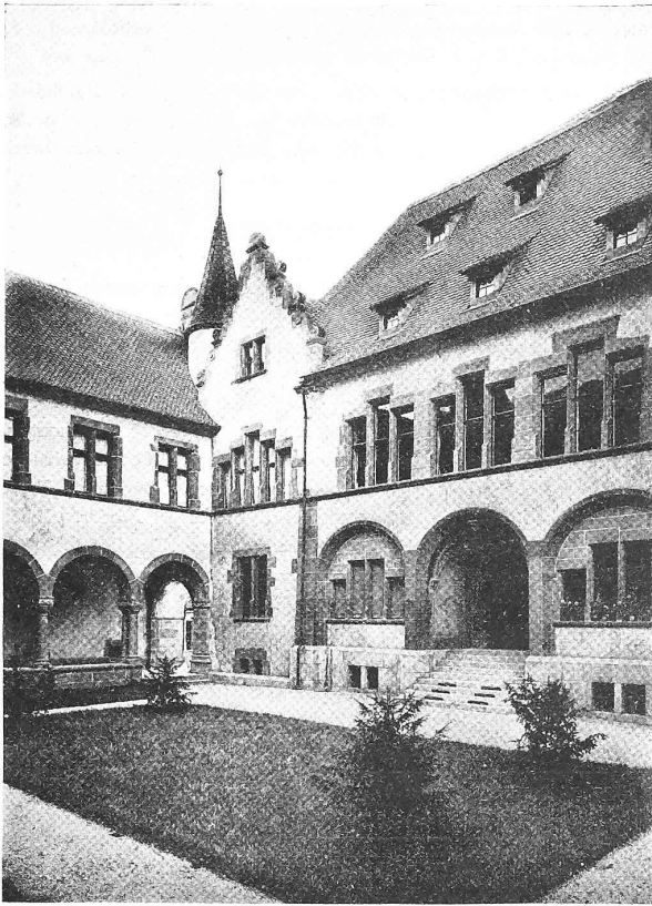
Abb. 44. Haupteingang zum Verwaltungsgebäude des Staatsarchivs im Hof an der Martinsgasse.

Bauleitung, andererseits hatte sie die gute Wirkung, den Wett-eifer unter den beteiligten Unternehmern zu fördern. Im allgemeinen wurde die erfreuliche Wahrnehmung gemacht, dass die ausführenden Kräfte zu einem guten Teil Verständnis zeigten für die eigenartigen Anforderungen, welche der Bau bedingte.