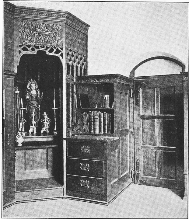
Abb. 18. Aus der Sakristei.

Von Karl Moser, Architekt in Firma Curjel & Moser in Karlsruhe.