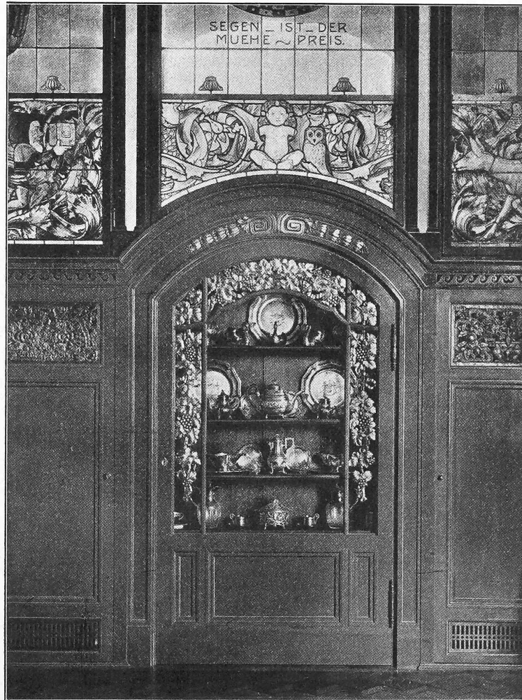
Abb. 3. Silberschrank im Esszimmer der Villa Stollwerk in Köln a. Rh. Nach Entwürfen von Professor Bruno Schmitz in Charlottenburg.