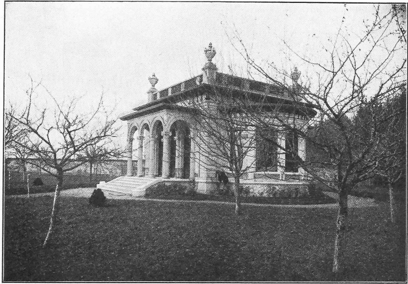
Fig. 10. Pavillon de Préfargier. — Architecte M. Léo Châtelain à Neuchâtel.

weil dieser bei schnellfahrenden Zügen durch das Feuerungsgeschäft hinreichend in Anspruch genommen wird und überdies mit seinen oft von Feuer geblendeten Augen häufig nicht in der Lage wäre, die Stellung der Signale rechtzeitig mit Sicherheit zu erkennen.