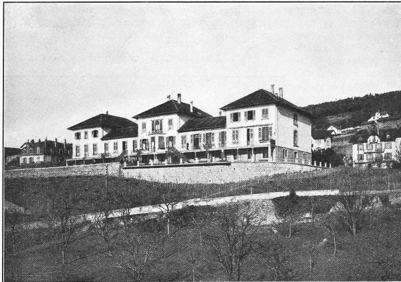
Fig. 8. «La Maternité» à Neuchâtel. — Façade du sud. — Arch. M. Léo Châtelain à Neuchâtel.