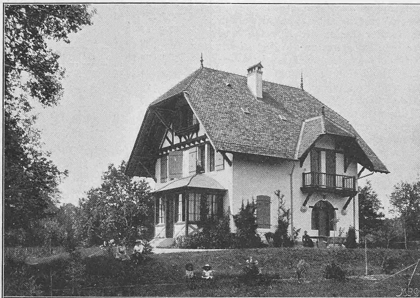
Fig. 59. Villa Cougnard. — Architectes: MM. de Morsier frères et Weibel.

Notons encore du même architecte une charmante construction rustique à Ruth (Fig. 58), c'est une dépendance