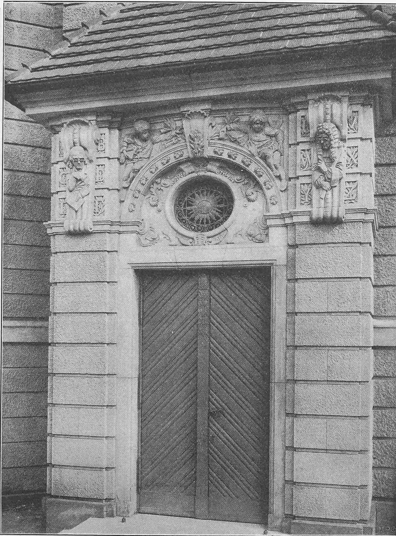
Abb. 13. Knaben-Portal der Gemeindeschule in der Wilmsstrasse. Erbaut von Stadtbaurat L. Hoffmann in Berlin.

Schmuckembleme, Hoffmanns künstlerische Schwäche, gesucht und gekünstelt wirken, wie z. B. am Hause der Feuerwache oder gar an Hoffmanns unbefriedigender Arbeit der letzten Zeit, dem Berliner Feuerwehr-Denkmal , so sind doch bei den von uns vorgeführten Beispielen fast immer die Architektur-Teile mit ihrem Schmuck zu einem einheitlichen Ganzen vereinigt, das auf der weiten glatten Mauerfläche oder in seiner sonstigen Umgebung eine sorgsam berechnete Wirkung erzielt. So stellen Hoffmanns städtische, in rascher Folge entstandene Monumentalbauten eine freudigste zu begrüßende Wendung dar vom reinen Nützlichkeitsbau zum Kunstbau, für den praktische Bestimmung und künstlerische Erscheinung die gleiche Bedeutung haben.