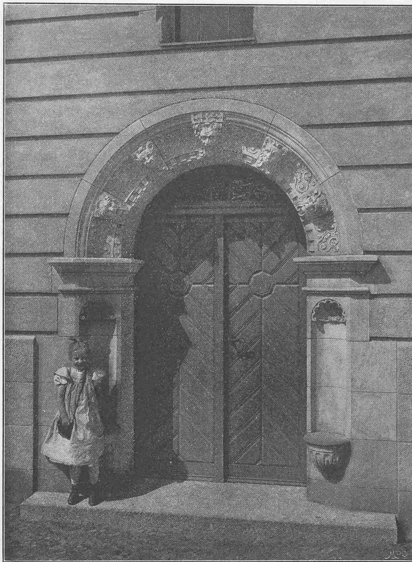
Abb. 12. Portal vom Lehrerhause der Gemeindeschule in der Christianiastrasse.